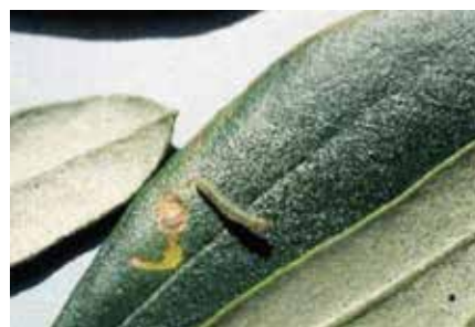
Larva di tignola dell'olivo generazione fillofaga

- larve di 3° generazione (fillofaga): queste larve scavano gallerie nel parenchima fogliare e giunte a maturità le foglie vengono erose dall'esterno.