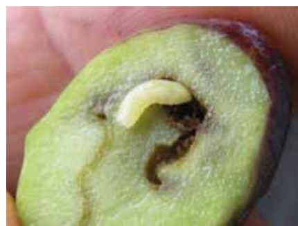
Larva di tignola dell'olivo generazione carpofaga

- larve di 2° generazione (carpofaga): le larve di questa generazione sono le più dannose, in quanto attaccando i frutticini grazie alla loro attività minatoria scavano gallerie fino all'endocarpo determinando la cascola anticipata dei frutti quando lo sviluppo del frutticino ha la dimensione di un grano di pepe (luglio), ed una cascola tardiva che si manifesta in settembre-ottobre.