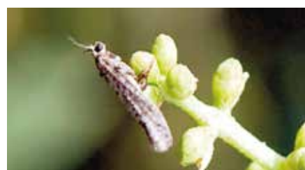
Individuo adulto di tignola dell'olivo

Considerato ciò, in quest'articolo verranno illustrati i metodi di difesa sostenibili per contrastare uno dei principali fitofagi dell'olivo, la prays oleae. La prays oleae, pur non essendo il fitofago principale all'interno dell'agroecosistema olivo, in annate favorevoli al suo sviluppo e in assenza di adeguati sistemi di monitoraggio, può raggiungere densità di infestazioni superiori alla soglia di danno economico. La tignola dell'olivo è un microlepidottero presente in tutte le aree olivicole italiane. Questo fitofago compie 3 generazioni all'anno. Il 1° sfarfallamento degli adulti avviene in marzo-aprile e si conclude in maggio; il 2° volo inizia a fine maggio e si completa a fine luglio; il 3° volo inizia a settembre e si conclude a novembre.